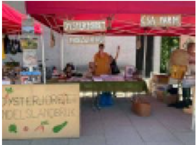
Dysterjordets stall på Grønn festival i Ås.

Moer sykehjem kom på besøk. Besøket var del av Dysterjordets sosiale ansvar hvor vi sette av 1% av omsetningen.